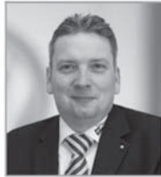
Marc Walden Auto Schmeink Wesel