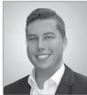
Aaron Raak AH an Rhein & Lippe

Ihre Volkswagen & Audi Partner für Wesel und Bocholt.