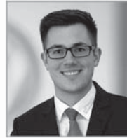
Martin Langenhoff Auto Schmeink Wesel