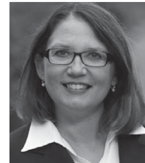
ULRIKE WESTKAMP BÜRGERMEISTERIN STADT WESEL

Mit Optimismus und frischer Kraft startet der Badminton-Verein Wesel Rot-Weiss e.V. in die Saison 2016/2017.